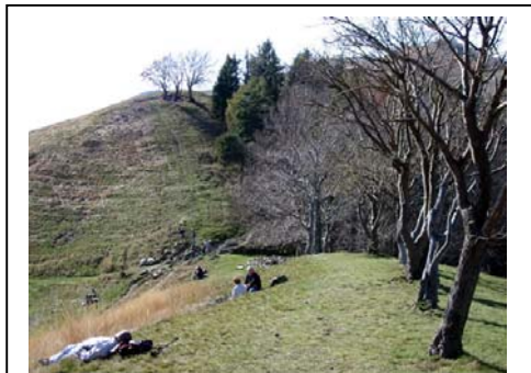
Bocchetta di Molina

Stiamo percorrendo il sentiero nr. 1 , (quello che, volendo, arriva sino a Bellagio, ma sono oltre 30 km !) e quando, superato il rifugio Boletto, ci troviamo in vista dell'omonimo monte il panorama si fa più aperto e aereo. Giungiamo alla Bocchetta di Molina/Baita San Pietro, luogo gradevolissimo, soleggiato e ideale per un adeguato relax.