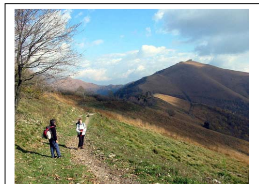
in vista del Monte Boletto

Camminiamo in costante leggera salita, evitando le deviazioni per Torno ecc., fino alla Baita Bondella (1075 m - qui ottime torte casalinghe). Ora inizia la parte più panoramica dell'itinerario: con scorci bellissimi sui monti della zona lariana, sulle più distanti cime alpine e sullo specchio azzurro del lago che si distende ai nostri piedi.